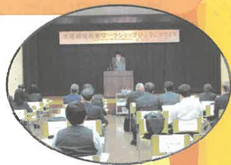
昨年の風景(コロナ対策のため来場者の間隔を確保して開催)