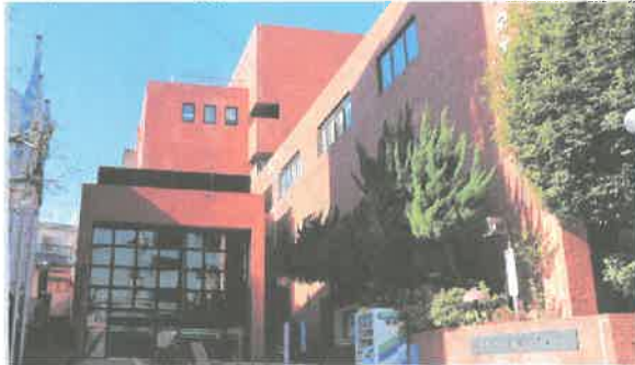
兵庫県中央労働センター