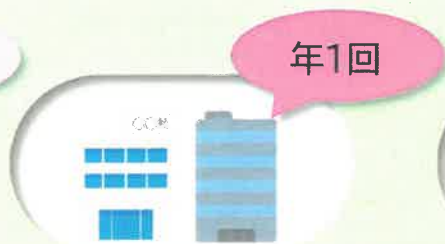
【継続的取引先(小規模)】