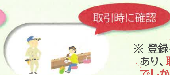
【新規・単発の取引先】

※ 登録は、自ら届出等しない限り有効であり、 取消しも課税期間(原則1年)単位 でしかできないため、これらも踏まえてご検討ください