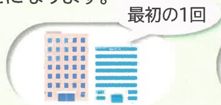
【継続的取引先(大手)】

☞ ただし、必ずしも取引の都度確認する必要はなく、 取引先の規模・関係性・取引の継続性 などを踏まえ、判断※することになります。